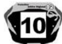
Elite1 Fet G en 20'' et Cruiser