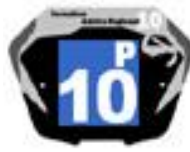
Filles / Femmes