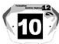
Junior Fet G / Elite2 en 20'' et Cruiser